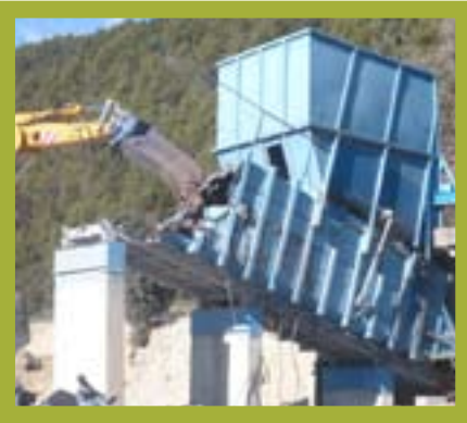
Démantèlement de l'ancien quai de transfert des ordures ménagères