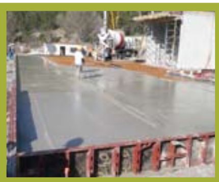
Réalisation de la structure béton

Acheminer directement les déchets vers leur centre de traitement le plus proche, à Roussas, reviendrait à multiplier les kilomètres parcourus par les camions-bennes par deux !