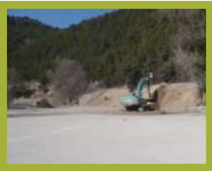
Premiers travaux de terrassement