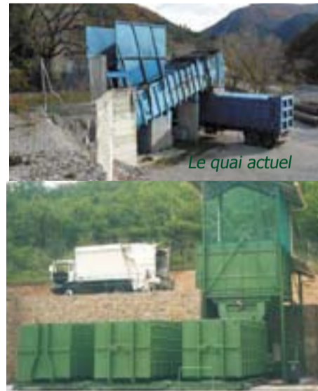
La rénovation va permettre d'installer plusieurs bennes de stockage

Cet équipement est indispensable car il permet de réduire de moitié le transport des déchets. Après plus de 20 années de service, le quai est arrivé en fin de vie. Sa rénovation va permettre d'économiser des frais de maintenance trop importants, de faciliter le travail des agents de collecte, d'améliorer la collecte sélective grâce à la possibilité de stocker différents déchets séparément et de réduire les frais de transport en camion benne. Les emballages recyclables, aujourd'hui acheminés à la déchetterie de Valréas, pourront être directement stockés à Aubres avant leur transfert en centre de tri.