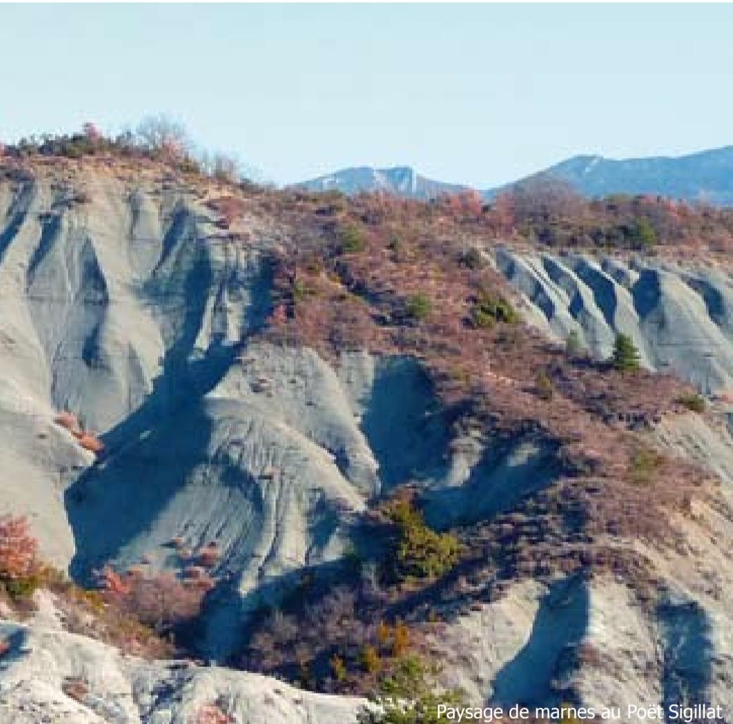
Paysage de marnes au Poët Sigillat

Le site portail des services et informations du Pays de Nyons