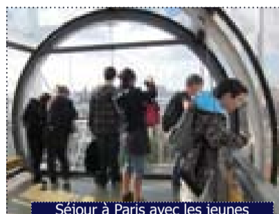
Séjour à Paris avec les jeunes de l'atelier Tous artistes

Durant les journées « Cinéma du monde » organisées à Sainte-Jalle cet été, l'AASHN s'est chargée de confectionner les repas.