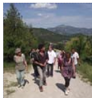
Randonnée ornithologique Chorale des trois vallées

Depuis 2004, chaque année dans un village différent, l'AASHN organise la « Fête du Printemps » : une journée festive qui rassemble les idées, les savoir-faire des habitants et des associations pour une journée conviviale autour d'activités ouvertes à tous. A Montaulieu en 2011, habitants et associations locales ont joué le jeu pour une journée réussie : représentation théâtrale, randonnée commentée par un ornithologue, « Chorale des trois vallées », animation poterie, interventions d'historiens locaux... Le village d'Aubres devrait se mobiliser pour accueillir cette manifestation l'an prochain.