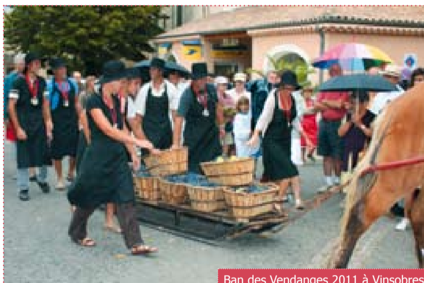
Ban des Vendanges 2011 à Vinsobres

Ce projet donne l'occasion de dynamiser dans le même temps différentes composantes de l'activité économique et touristique du territoire. La place centrale donnée au vin et à la vigne dans ces offres touristiques permettra de conquérir une nouvelle clientèle et viendra appuyer le développement de nombreux acteurs locaux.