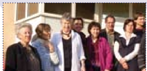
Les élus lors de la Fête des 10 ans de l'association