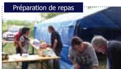
Préparation de repas

Durant les journées « Cinéma du monde » organisées à Sainte-Jalle cet été, l'AASHN s'est chargée de confectionner les repas.