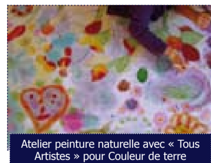
Atelier peinture naturelle avec « Tous Artistes » pour Couleur de terre

Pour mettre en œuvre ses actions en faveur de la jeunesse, l'AASHN fait partie du réseau des coordonnateurs Enfance Jeunesse animé par le service action sociale de la Communauté de communes du Val d'Eygues. Ce travail collaboratif permet de faire remonter et de prendre en compte les besoins des communes du haut nyonsais dans la définition des actions à engager et d'organiser des événements communs au haut et au bas nyonsais, telle la journée d'animation « Couleur de terre » destinée aux enfants et aux parents.