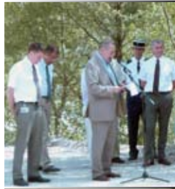
22 juillet 2009 Inauguration du quai de transfert des déchets ménagers rénové en présence du Préfet de la Drôme et des élus locaux.