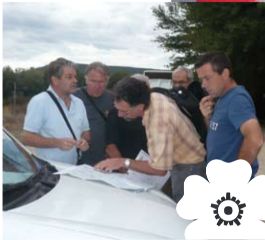
Reconnaissance de la voie douce Elus et techniciens reconnaissent le tracé de la future voie douce entre Saint-Maurice et Sahune.