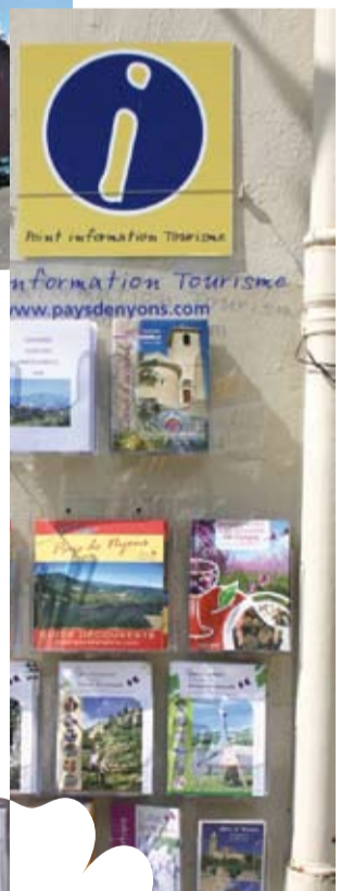
La saison touristique 2009 marque l'arrivée des nouveaux «Points Information Tourisme» dans 6 communes La Boulangerie d'Aubres, l'Agence Postale de Condorcet, le Restaurant au coeur du village de Curnier, l'Épicerie de Sainte-Jalle et les Bistrots de Pays de Venterol et de Saint-Maurice.