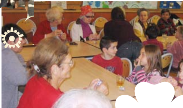
Tout au long de l'année... Rencontres entre les enfants du Centre de loisirs et les personnes âgées résidentes des maisons de retraites.