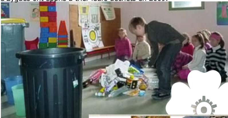
Sensibilisation au tri sélectif et au développement durable Autour de 400 enfants des écoles maternelles et primaires du Val d'Eygues ont appris à trier leurs déchets en 2009.