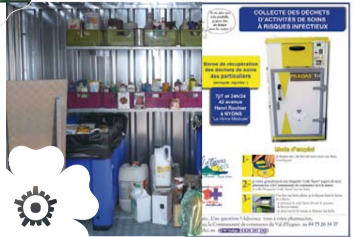
Optimisation du service de collecte de déchets ménagers Mise en place de la collecte des Déchets d'Activités de Soins à Risque Infectieux et des Déchets Dangereux des Ménages.