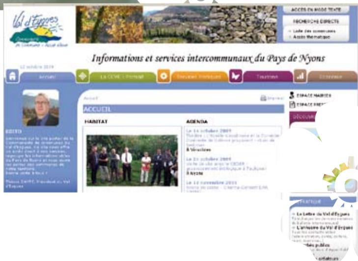
L'intercommunalité plus proche de vous Mise en ligne du site portail internet de la Communauté de communes qui intègre des pages dédiées à chaque commune membre.