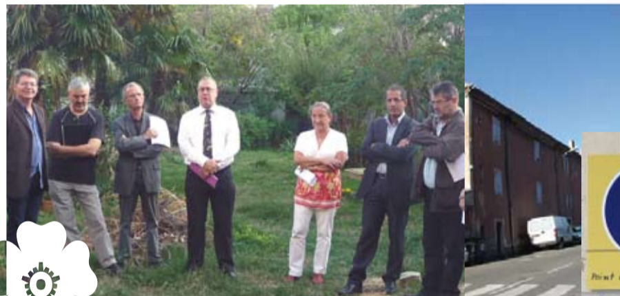
Inauguration par les élus et les partenaires financiers de plusieurs logements rénovés grâce aux aides d'amélioration à l'habitat. 79 logements ont été rénovés dans le cadre de l'OPAH (Opération Programmée d'Amélioration de l'Habitat) et du PIG (Programme d'Intérêt Général) sur les 4 Communautés de communes des Baronnies depuis 2007.