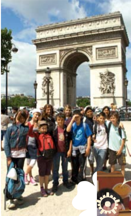
Juillet 2009 Mini-camp à Paris pour les enfants du Centre de loisirs intercommunal.